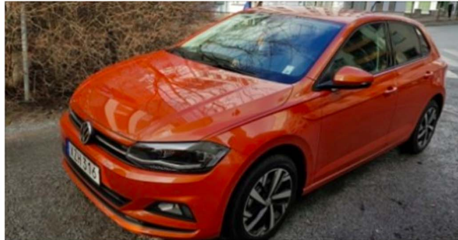
Volkswagen Polo 1.0 TGI