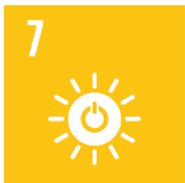
7 Hållbar energi för alla