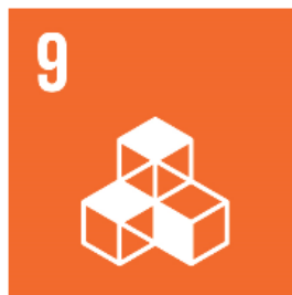
9 Hållbar Industri, Innovationer och Infrastruktur