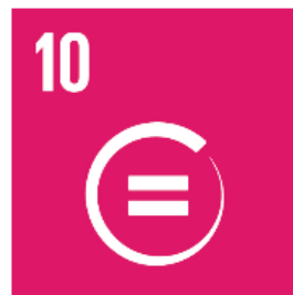
10 Minskad ojämlikhet