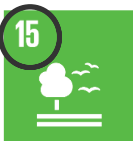
15 Ekosystem och biologisk mångfald