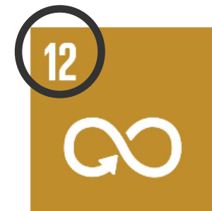
12 Hållbar konsumtion och produktion