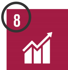
8 Anständiga arbetsvillkor och ekonomisk tillväxt