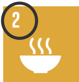
2 Ingen hunger