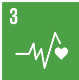
3 Hälsa och välbefinnande