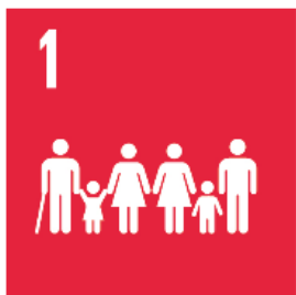
1 Ingen fattigdom