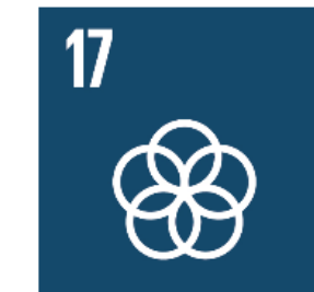
17 Genomförande och globalt partnerskap